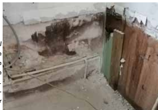
Feuchte, von Schimmel befallene Wände, wie in diesem Beispiel, sind in älteren Wohnhäusern keine Seltenheit. Die Ursache zu ergründen ist für Eigentümer oft nicht leicht.

Mauerwerk gelangen", so der Bauexperte. Undichte Dächer, Risse in der Fassade, Leitungsschäden, Feuchtigkeit aus dem Untergrund - die Liste möglicher Nässequellen ist lang. Selbst Restfeuchte bei einem Neu- oder Umbau kann zu Wasserflecken oder Schimmel führen. Im vorliegenden Fall empfahl er dem VWE-Mitglied, ein Spezialunternehmen zur Leckageortung. Mit Erfolg: Die Fachleute stellten einen Leitungsschaden in der Wand fest, der